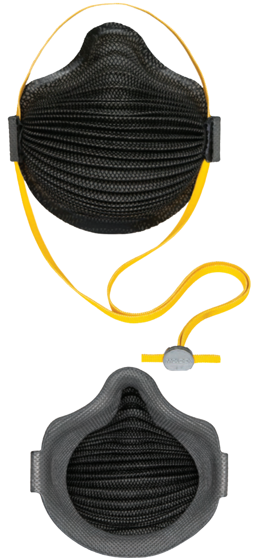
Sello Completo en Serie M4620

*Siempre consulte las advertencias, limitaciones y restricciones antes de usar respiradores Moldex en cualquier entorno o aplicación