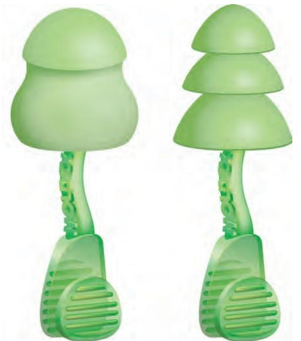
6940 & 6945 Glide Foam