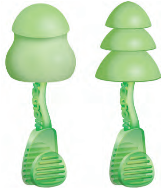
6940 & 6945 Glide de Espuma