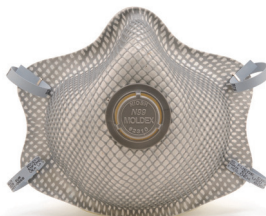
2310V Respiradores 2310N99 2 Por Empaque/40 Por Caja