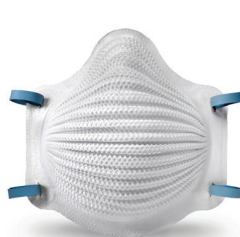
4200V Respirador AirWave® 4200N95 2 Por Empaque/ 40 Por Caja