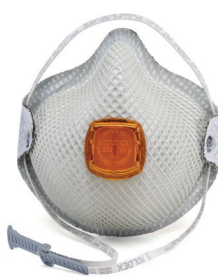
2800V Respirador HandyStrap® 2800N95 Más Molestia po Vapores Orgánicos con Válvula Ventex® 2 Por Empaque/40 Por Caja