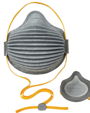
4800V Respirador Airwave® 2800N95 Más Molestia por Vapores Orgánicos con Banda SmartStrap® 2 Por Empaque/40 Por Caja