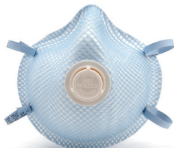
2300V Respiradores 2300N95 2 Por Empaque/40 Por Caja