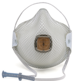
2700V Respirador HandyStrap® 2700N95 con Válvula Ventex® 2 Por Empaque/ 40 Por Cajat