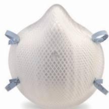
2200V Respiradores 2200N95 2 Por Empaque/ 50 Por Caja