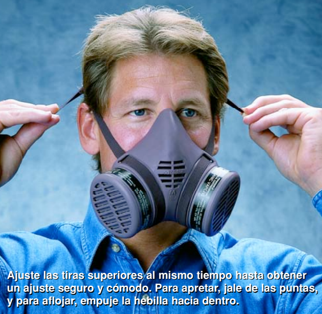
Ajuste las tiras superiores al mismo tiempo hasta obtener un ajuste seguro y cómodo. Para apretar, jale de las puntas, y para aflojar, empuje la hebilla hacia dentro.