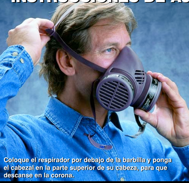
Coloque el respirador por debajo de la barbilla y ponga el cabezal en la parte superior de su cabeza, para que descansa en la corona.