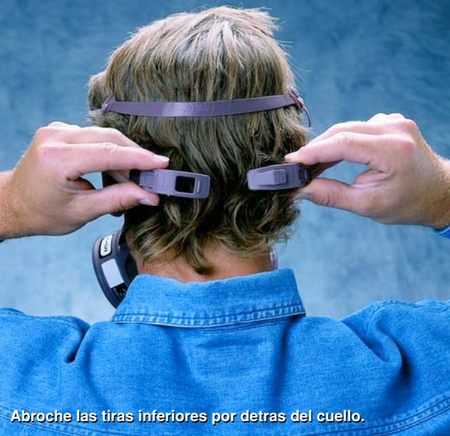
Abroche las tiras inferiores por detras del cuello.