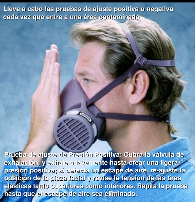
Lleve a cabo las pruebas de ajuste positiva o negativa cada vez que entre a una área contaminada.